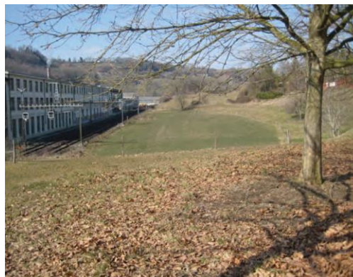
Venoge Parc, 2011