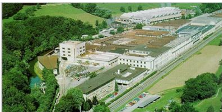
Vue d'ensemble du site (partie nord), Venoge Parc, 2011