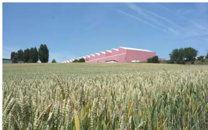
L'îlot « Crocodile COOP » (F&K/mrs/Topos)

Liens : http://www.vd.ch/themes/economie/developpement-economique/economie-regionale/projets-cofinances/