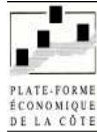
PLATE-FORME ÉCONOMIQUE DE LA CÔTE