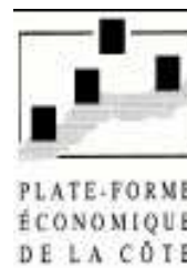
PLATE-FORME ÉCONOMIQUE DE LA CÔTE