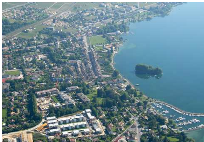
Vue aérienne de Rolle ( www.rolle.ch )

Informations dépourvues de foi publique. Des renseignements complémentaires concernant la disponibilité des terrains et des locaux sont disponibles auprès des associations économiques régionales.