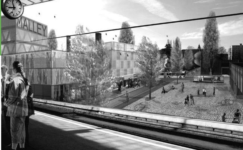
Vision d'avenir pour le futur éco-quartier de Malley