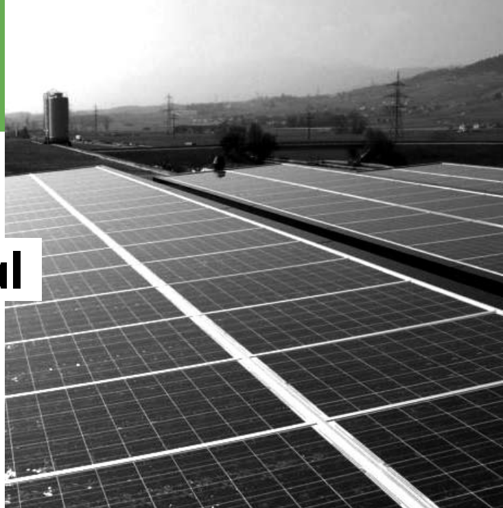
Une référence: le centre d'entretien autoroutier de Bursins est autonome en énergie. Cette réalisation a reçu le Prix solaire Suisse 2007

Dans la foulée des engagements pris par la communauté internationale à Rio de Janeiro en 1992, puis de la démarche lancée en Suisse sous l'égide de la Confédération, le gouvernement vaudois mène une réflexion continue sur le thème du développement durable. A son initiative ou en réponse à des interventions parlementaires, un grand nombre de politiques et d'actions sont d'ores et déjà conduites dans le sens du développement durable, par exemple dans les domaines des marchés publics, du développement économique, de la politique forestière ou en matière de concours d'architecture.