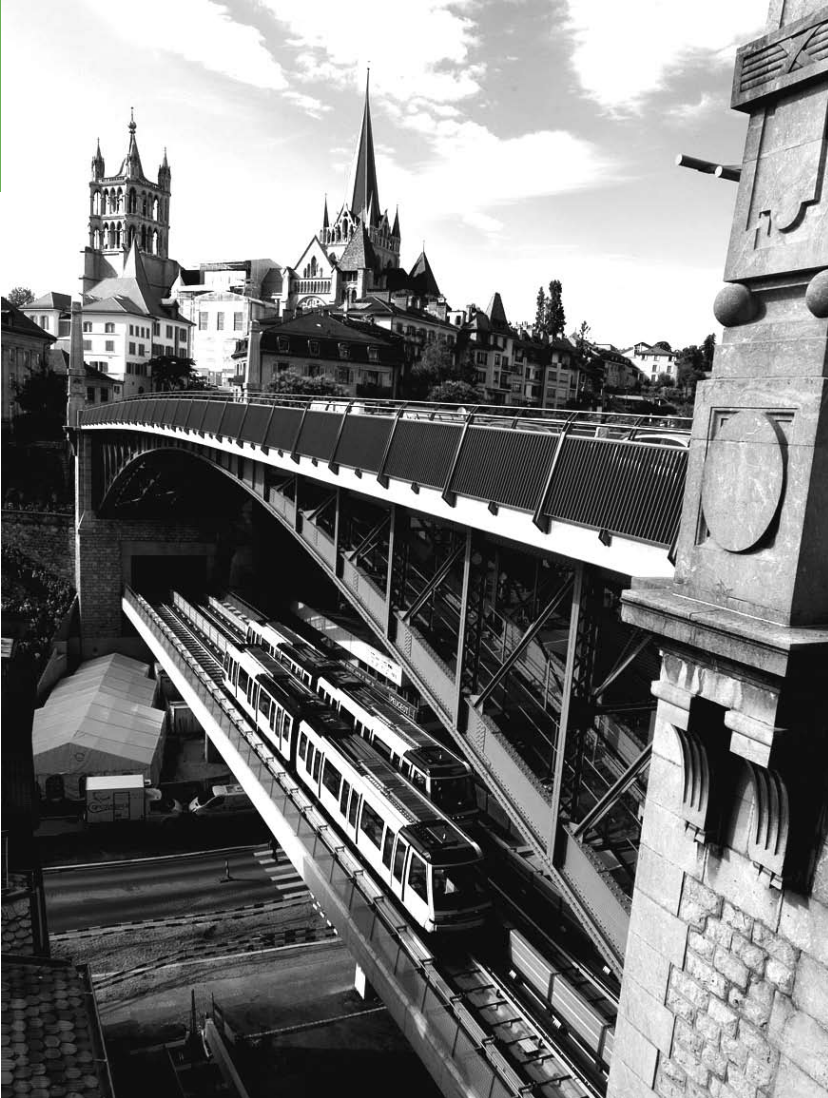
Le métro m2 à Lausanne