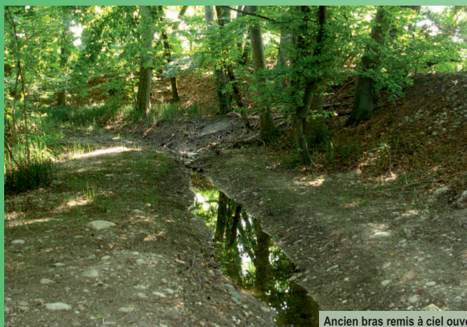
Ancien bras remis à ciel ouvert

La Serine joue un rôle important de corridor biologique dans la région de Gland. La Commune a souhaité entreprendre une remise à ciel ouvert d'un collecteur d'eaux claires situé dans un ancien bras asséché de la Serine, au lieu-dit Froide Fontaine. Une stabilisation présente en rive droite ainsi qu'un seuil infranchissable pour la faune piscicole en aval d'un pont artificialisaient ce tronçon de la Serine.