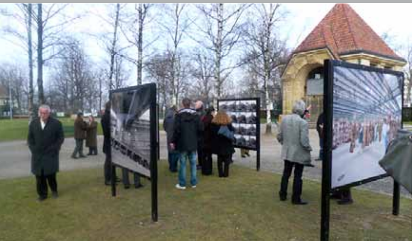
L'exposition «Flux» sur l'Esplanade de Montbenon à Lausanne ...