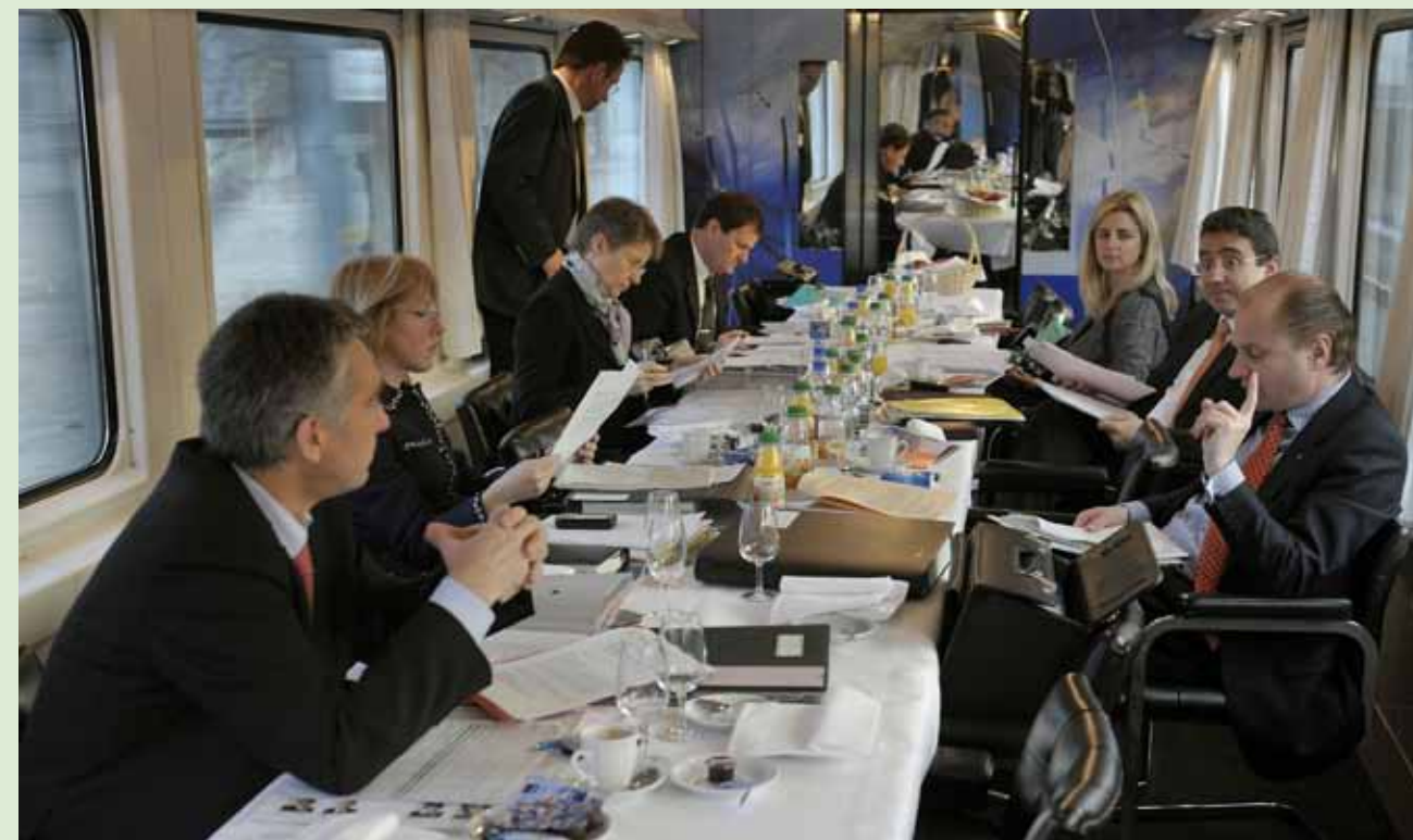
4 février 2009. Première pour le Conseil d'Etat vaudois : attendu à Bâle par le Gouvernement tout juste élu, il a tenu sa séance hebdomadaire dans un wagon-salon spécialement mis à disposition par les CFF.

Glaris (3 mai 2009). Le Gouvernement du Canton de Glaris a reçu le Conseil d'Etat vaudois en qualité d'hôte d'honneur de sa Landsgemeinde 2009. Amicale et conviviale, cette rencontre a permis d'établir des liens et de procéder à un partage de points de vue et d'expériences dans divers domaines.