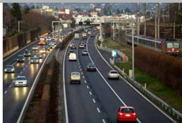
Les projets d'agglomération et les différents projets pour résorber les goulots d'étranglement autoroutiers devraient contribuer à faciliter la mobilité aux portes des grandes villes.

Si le Conseil d'Etat approuve avec satisfaction le choix de la Confédération de soutenir de façon importante la mobilité douce et les transports publics dans les agglomérations vaudoises, l'incertitude liée à la disponibilité financière du fonds d'infrastructure continue de l'inquiéter.