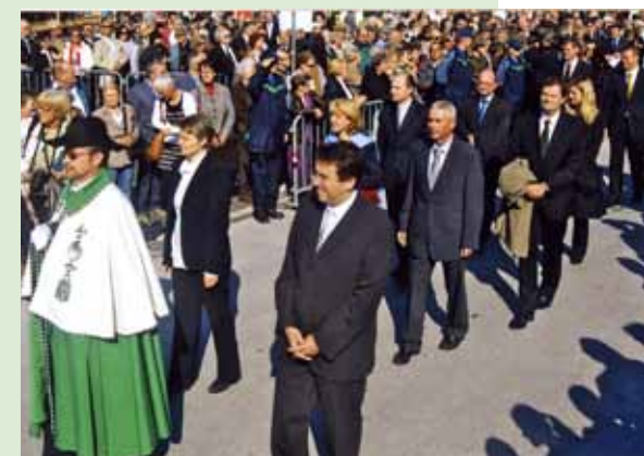
3 mai 2009. Invité de la Landsgemeinde de Glaris, le Conseil d'Etat vaudois est reçu par les autorités glaronaises.

Bâle-Ville (4 février 2009). Les deux exécutifs des cantons de Vaud et de Bâle-Ville se sont rencontrés dans la Cité rhénane, au terme de la première séance de la nouvelle législature du gouvernement bâlois. Cette première rencontre bilatérale depuis de nombreuses années s'inscrit dans une volonté commune de renforcer les liens entre ces deux cantons qui présentent de fortes similitudes. Les deux entités sont, par exemple, les seules en Suisse à désigner leur présidente ou leur président pour la durée de la législature. Le Conseil d'Etat vaudois a souhaité valoriser ce déplacement en tenant sa propre séance hebdomadaire dans un wagon mis à disposition par les CFF. A Bâle, il a été reçu par la Direction générale de la société Novartis Suisse pour la présentation du «campus du savoir» avant de visiter le Schaulager, une institution originale dédiée à l'art contemporain.