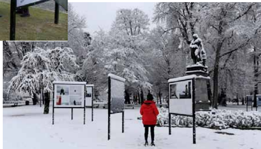
...et dans les Jardins de l'Europe à Annecy.