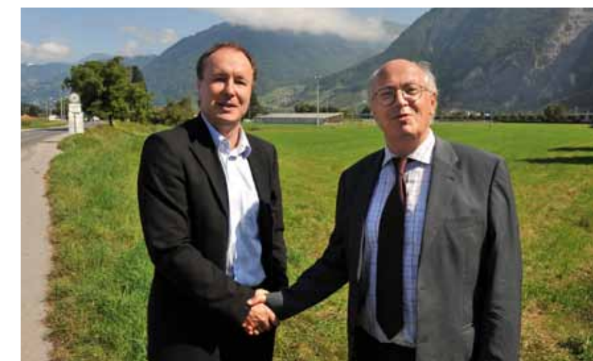
2 septembre 2008, Rennaz. Pierre-Yves Maillard, chef du Département de la santé et de l'action sociale, et son homologue valaisan Thomas Burgener visitent le site du futur hôpital intercantional Riviera-Chablais.

Le Grand Conseil vaudois a autorisé le 10 mars 2009 le Conseil d'Etat à adhérer à la Convention intercantonale créant l'Hôpital Riviera-Chablais Vaud-Valais. Le Valais avait pris la même décision le 10 février 2009. La Convention intercantonale sur l'Hôpital Riviera-Chablais est entrée en vigueur le 1 er juillet 2009. Ce projet est l'aboutissement d'un long travail qui a débuté il y a plus de dix ans. Il élargit à la région de la Riviera la collaboration instaurée en 1998 entre les deux cantons par la création de l'Hôpital du Chablais. Le futur établissement se composera d'un nouveau site de soins aigus de 300 lits à Rennaz, ainsi que de deux centres de traitement et de réadaptation comprenant chacun 75 lits, avec antenne médico-chirurgicale pour le traitement des petites urgences. L'un à Vevey pour la population de la Riviera et l'autre à Monthey pour la population du Chablais vaudois et valaisan. Cette structure, qui aura la forme d'un établissement autonome de droit public intercantional avec personnalité juridique, devrait ouvrir ses portes en 2015. Elle remplacera les cinq sites actuels de soins aigus (Samaritain et la Providence à Vevey, et les hôpitaux de Montreux, Aigle et Monthey).