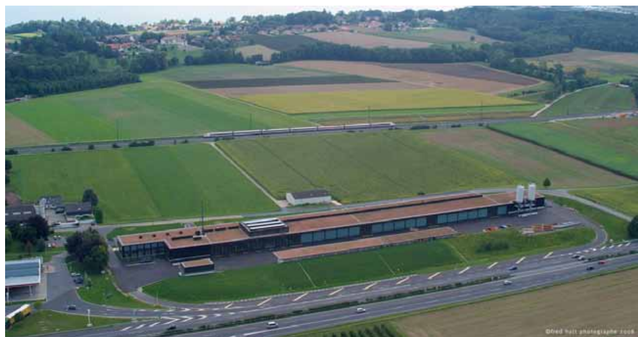
Centre d'entretien des routes nationales à Bursins.

Le Comité stratégique a poursuivi ses travaux de révision totale du dispositif conventionnel régissant la HES-SO. En avril 2009, le Département fédéral de l'économie, dont dépendent les HES, a chargé un groupe d'experts d'examiner l'avant-projet de convention proposé par le comité stratégique. Objectifs : évaluer dans quelle mesure la HES-SO remplit les conditions requises pour obtenir l'autorisation définitive du Conseil fédéral, ainsi que les conditions pour une accréditation institutionnelle conformément à la future loi fédérale sur l'aide aux hautes écoles et la coordination dans le domaine des hautes écoles. Le 28 août 2009, la cheffe du Département fédéral de l'économie et les conseillères et conseillers d'Etat des cantons responsables de la HES-SO ont pris connaissance de ce rapport et ont discuté ensemble de la suite du processus. Conformément au mandat attribué, le groupe d'experts a examiné les structures de conduite et d'organisation de la HES-SO, mais non pas la qualité – qui est incontestée – de l'enseignement, de la recherche et des services. Le rapport recommande une série de mesures visant à renforcer la conduite académique et opérationnelle de la HES-SO.