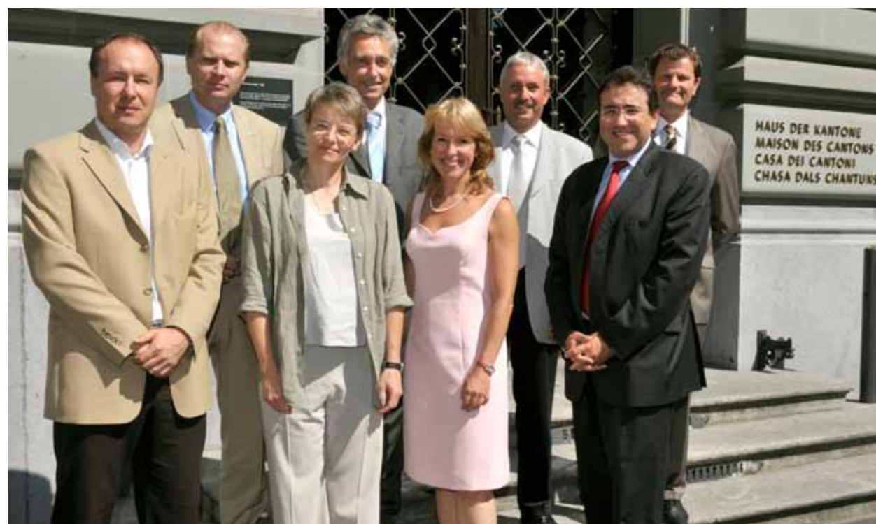
18 août 2008. Le Conseil d'Etat vaudois est le premier à tenir sa séance hebdomadaire à Berne, dans la Maison des Cantons fraîchement inaugurée.