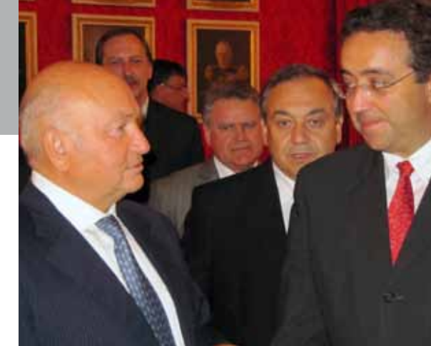
15 septembre 2009. Le maire de Moscou Youri Louchkov et le président vaudois Pascal Broulis paraphent l'accord de coopération économique.

A l'initiative de l'ambassade de Suisse à Moscou, une délégation composée de représentants du Conseil d'Etat, de la Municipalité de Lausanne, ainsi que des milieux économiques, académiques, sportifs et culturels du canton s'est rendue dans la capitale russe du 13 au 16 septembre 2009. L'événement avait pour objectif de favoriser les échanges commerciaux avec la Russie et de promouvoir les atouts du Canton en matière de formation et de tourisme. Un programme culturel a par ailleurs offert aux Moscovites un aperçu de la création vaudoise. De nombreux représentants de l'économie privée se sont associés à cette opération, cofinçant celle-ci à hauteur de 49 %. Dans le cadre du programme diplomatique, la délégation vaudoise a rencontré des représentants de la Douma et a été officiellement reçue par le maire de Moscou, Youri Louchkov. Ce dernier a apporté son soutien à l'accord de coopération économique signé en sa présence entre la Chambre de Commerce et de l'Industrie de Moscou et la Chambre bilatérale de commerce Suisse-Russie. Il a par ailleurs annoncé l'entrée de Moscou dans l'Union mondiale des villes olympiques