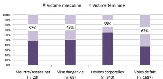
Infractions contre la vie et l'intégrité corporelle et tentatives, Police VD, 2007

Les données de police confirment que les femmes sont les principales victimes d'infractions contre l'intégrité sexuelle, dans l'enfance comme à l'âge adulte.