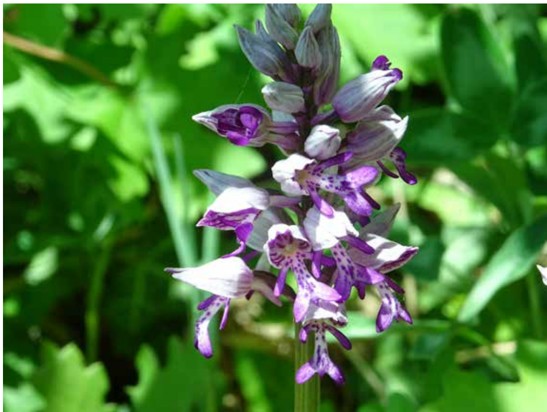
Certains talus inventoriés par Pro Natura ont une valeur inestimable car ils abritent plusieurs espèces rares et menacées, telles que cet Orchis militaris par exemple.