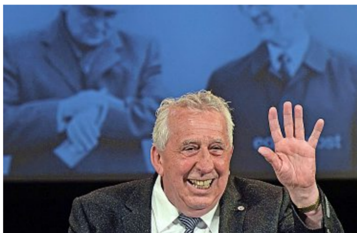
L'ultime dirigeant de la RDA, Egon Krenz, condamné en 1997 pour homicide, avait dénoncé la «justice des vainqueurs».