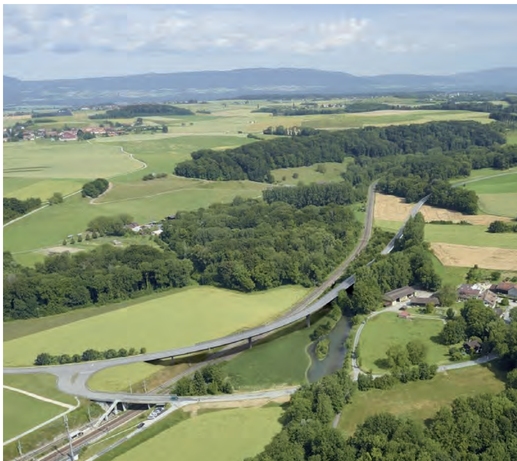
Photomontage du futur viaduc et mesure 4 du PAC Venoge