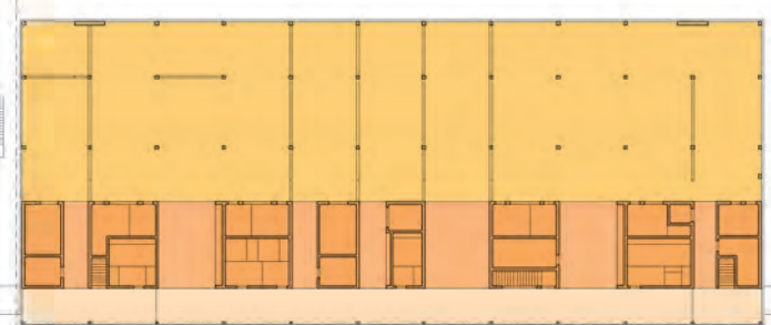
Rez-de-chaussée supérieur 1/750