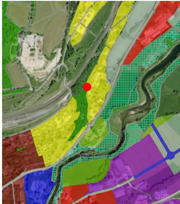
Extrait du plan d'affectation communal issu du guichet cartographique cantonal, échelle 1:10'000

Le Plan général d'affectation de la Commune de Vallorbe a été approuvé par le Département en charge de l'aménagement du territoire le 26 mai 2000.