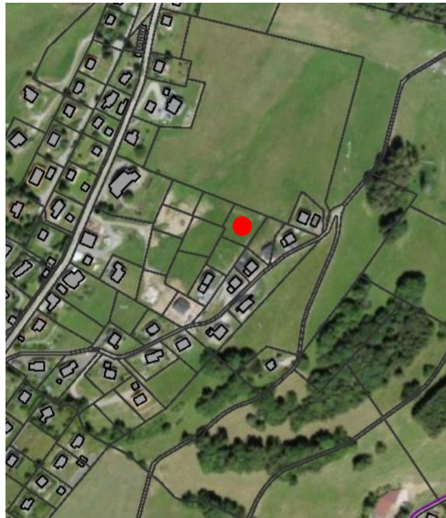
Plan de situation, échelle 1:5'000