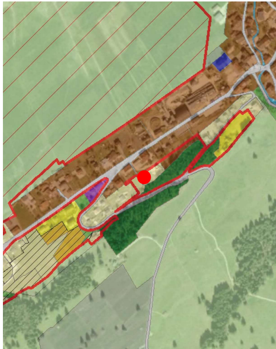
Extrait du plan d'affectation communal issu du guichet cartographique cantonal, échelle 1:10'000

Le Plan partiel d'affectation « Chez les Meylan » Le Brassus de la commune du Chenit approuvé par le Département en charge de l'aménagement du territoire le 14 juin 2002.