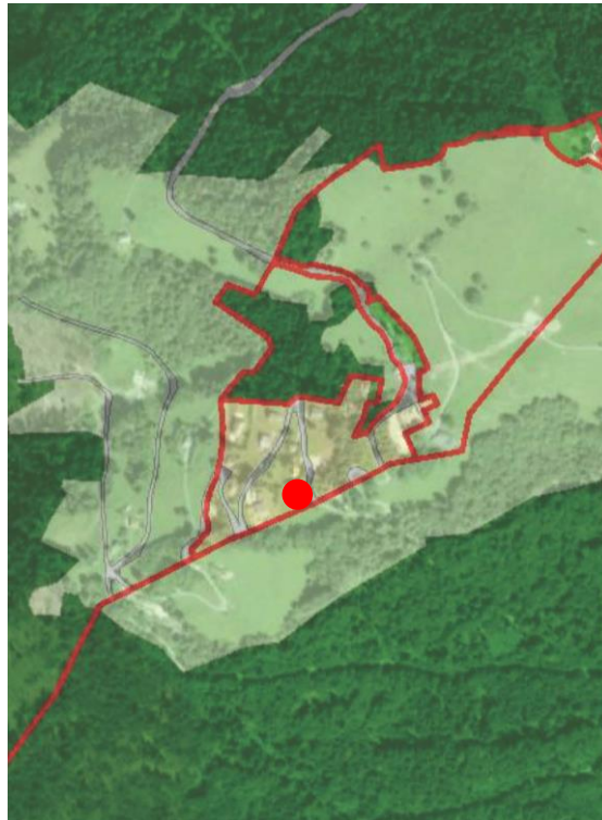
Extrait du plan d'affectation communal issu du guichet cartographique cantonal, échelle 1:10'000

Le plan d'extension partiel « En Sonchaux » de la Commune de Veytaux a été approuvé par le Conseil d'Etat le 11 octobre 1967.