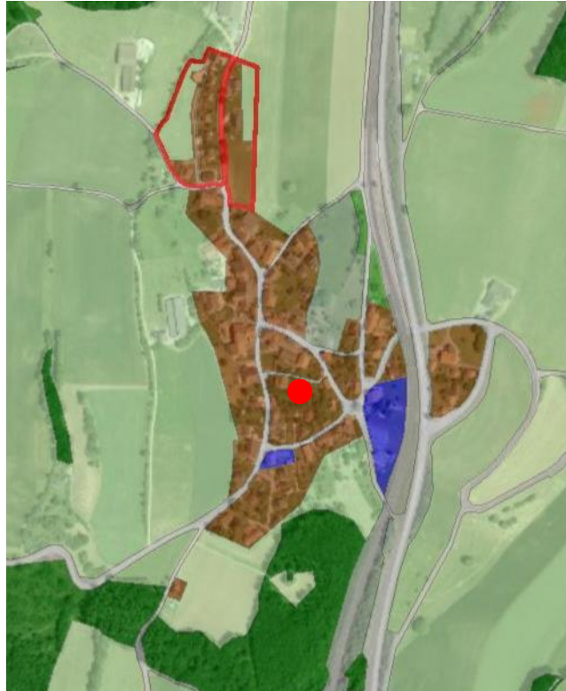
Extrait du plan d'affectation communal issu du guichet cartographique cantonal, échelle 1:10'000

Le Plan des zones de la Commune de Bretonnières a été approuvé par le Conseil d'Etat le 25 juin 1976.