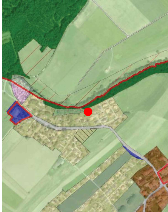
Extrait du plan d'affectation communal issu du guichet cartographique cantonal, échelle 1:10'000

Le Plan des zones de la Commune de Le Vaud a été approuvé par le Conseil d'Etat le 24 avril 1985.