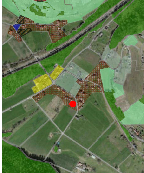
Extrait du plan d'affectation communal issu du guichet cartographique cantonal, échelle 1:10'000

Le Plan des zones Les Dévens de la Commune de Bex a été approuvé par le Conseil d'Etat le 9 octobre 1985.