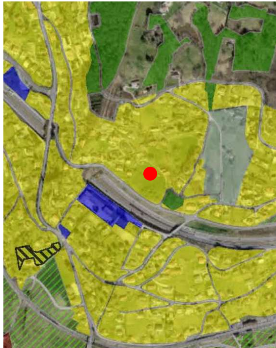
Extrait du plan d'affectation communal issu du guichet cartographique cantonal, échelle 1:10'000

Le Plan des zones de la Commune de Grandvaux a été approuvé par le Conseil d'Etat le 19 juin 1985 et la Modification du Plan des zones de la Commune de Grandvaux a été approuvé par le Conseil d'Etat le 18 décembre 1987.