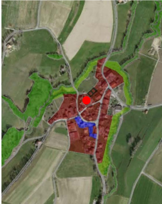
Extrait du plan d'affectation communal issu du guichet cartographique cantonal, échelle 1:10'000

Le Plan d'extension partiel « Le Village » de la Commune de Corcelles-le-Jorat a été approuvé par le Conseil d'Etat le 30 janvier 1985.