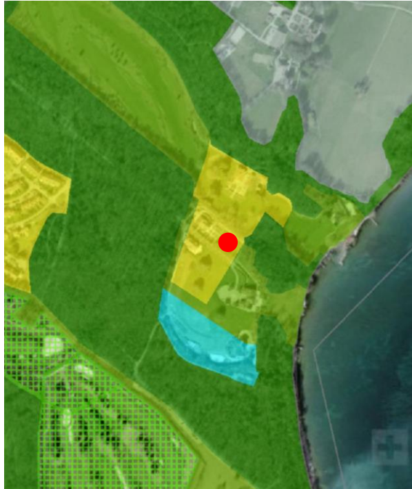
Extrait du plan d'affectation communal issu du guichet cartographique cantonal, échelle 1:10'000

Le Plan d'extension partiel « Villa Prangins – La Crique » de la Commune de Gland a été approuvé par le Conseil d'Etat le 10 février 1988.