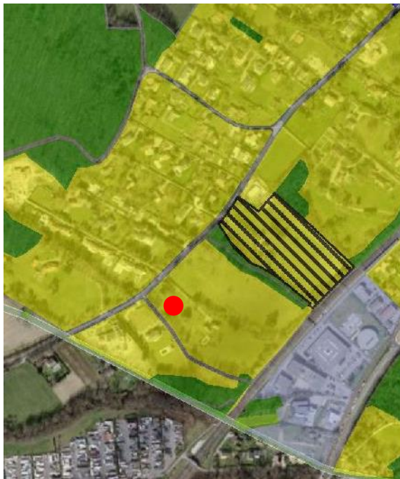
Extrait du plan d'affectation communal issu du guichet cartographique cantonal, échelle 1:10'000

Le Plan général d'affectation de la Commune de Mies a été approuvé préalablement par le Département en charge de l'aménagement du territoire le 22 septembre 2006 et mis en vigueur le 16 janvier 2007.