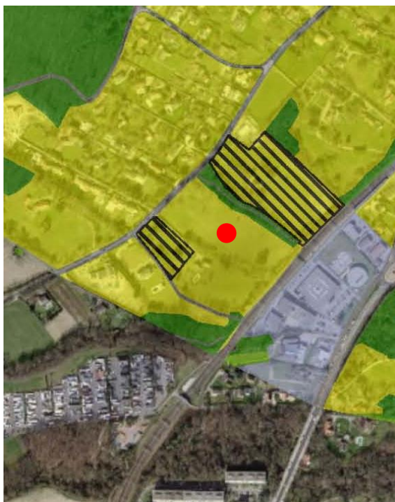
Extrait du plan d'affectation communal issu du guichet cartographique cantonal, échelle 1:10'000

Le Plan général d'affectation de la Commune de Mies a été approuvé préalablement par le Département en charge de l'aménagement du territoire le 22 septembre 2006 et mis en vigueur le 16 janvier 2007.