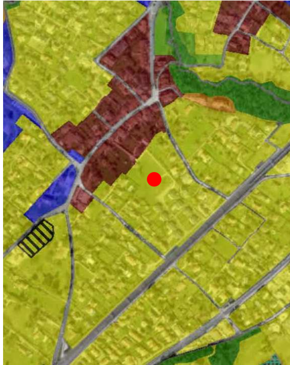
Extrait du plan d'affectation communal issu du guichet cartographique cantonal, échelle 1:10'000

Le Plan général d'affectation de la Commune de Mies a été approuvé par le Département en charge de l'aménagement du territoire le 22 septembre 2006.