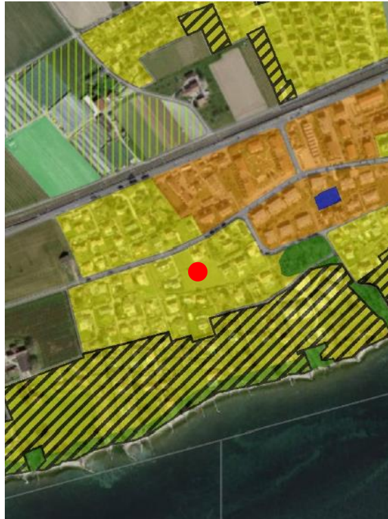
Extrait du plan d'affectation communal issu du guichet cartographique cantonal, échelle 1:10'000

Le Plan des zones de la Commune de Saint-Prex a été approuvé par le Conseil d'Etat le 15 juillet 1987.