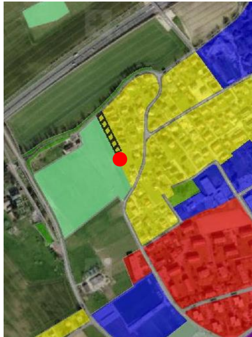
Extrait du plan d'affectation communal issu du guichet cartographique cantonal, échelle 1:10'000

Le Plan des zones de la Commune de Saint-Prex a été approuvé par le Conseil d'Etat le 15 juillet 1987.