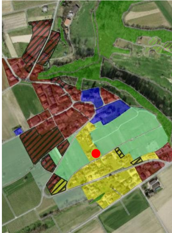
Extrait du plan d'affectation communal issu du guichet cartographique cantonal, échelle 1:10'000

Le Plan général d'affectation de la Commune de Constantine a été approuvé par le Département en charge de l'aménagement du territoire le 16 mai 2000.