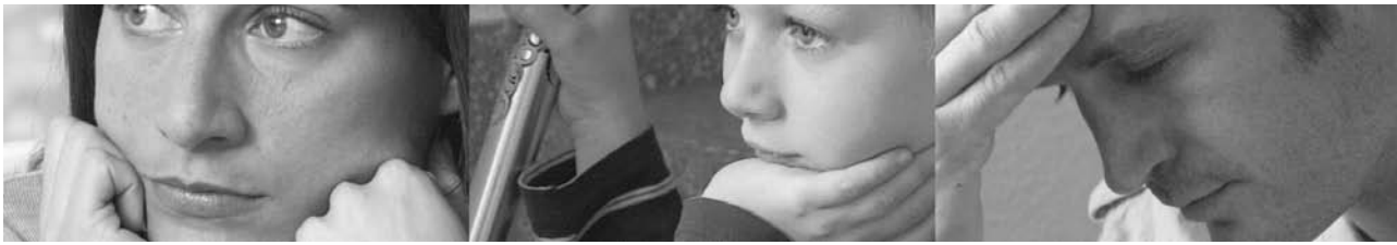
Violence domestique – Feuille d'information

lentes. D'autres en appellent à l'amour et au sens des responsabilités de la victime et promettent de s'amender. Dans l'espoir que leur partenaire va vraiment changer, beaucoup de victimes retirent alors leur demande de séparation ou reviennent sur les déclarations qu'elles ont faites, p. ex. dans le cadre d'une procédure pénale. Nombre de personnes concernées interrompent les consultations qu'elles avaient commencées ou des femmes quittent la maison d'accueil où elles avaient trouvé refuge pour réintégrer le domicile. Les victimes refoulent le souvenir des mauvais traitements, défendent leur auteur·e contre les personnes extérieures et minimisent la violence subie.