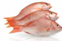
Poisson, 20 kg**

Poissons frais éviscérés et produits à base de poisson (frais, séché, cuit, fumé, autre conservation), y compris les crustacés et mollusques (morts)