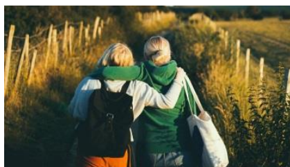
Site Internet ciao.ch

Le 1er janvier 2018, la loi sur l'accueil de jour des enfants (LAJE) est entrée en vigueur, venant concrétiser la journée continue des écoliers. Faisant suite à cette révision, le Conseil d'Etat a adopté, dans sa séance du 3 avril 2019, un nouveau règlement d'application de la LAJE (RLAJE), qui entrera en vigueur le 1er août 2019. D'autre part, l'Office de l'accueil de jour des enfants (OAJE) a mis à jour les directives pour l'accueil collectif préscolaire avec une entrée en vigueur qui aura lieu également le 1er août 2019. Il en va de même pour le référentiel de compétences pour l'accueil collectif parascolaire primaire qui est de la compétence de l'OAJE. Pour en savoir plus.