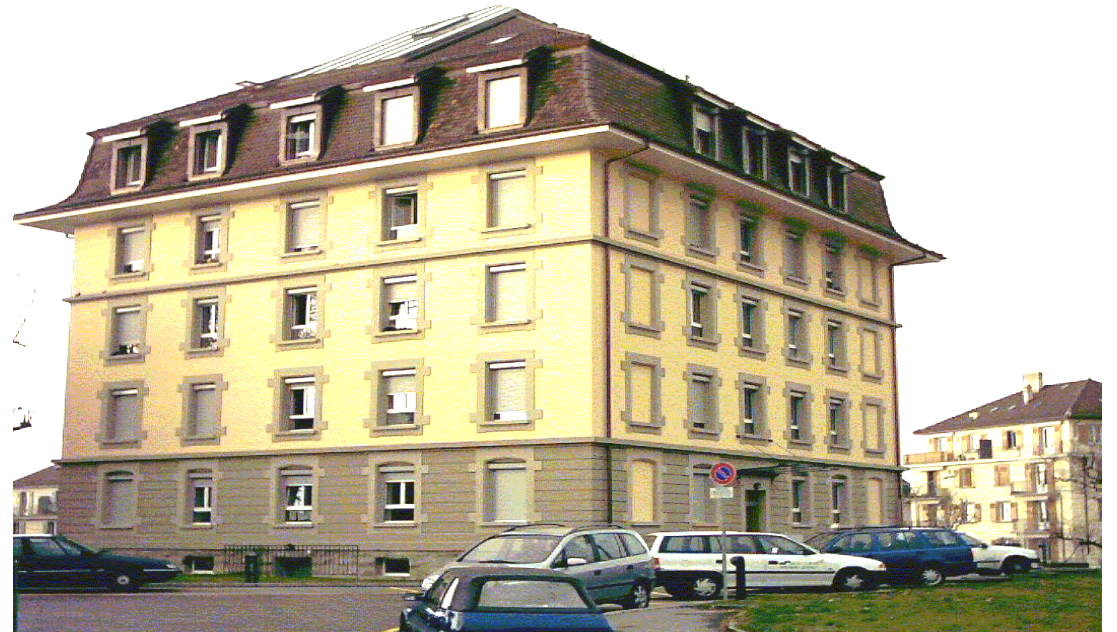
Ouvert en 2006, le premier foyer pour MNA à l'avenue du Chablais, Lausanne