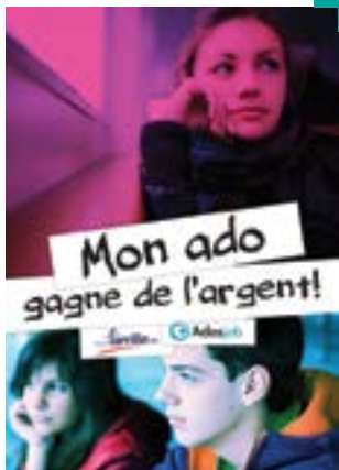
Table ronde « Mon ado gagne de l'argent ! »

Association Ados job Information et prévention