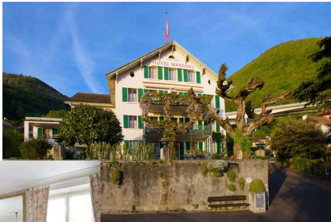
Hôtel Masson (Veytaux)